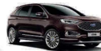
Ametista Scura Metallic-Lackierung*