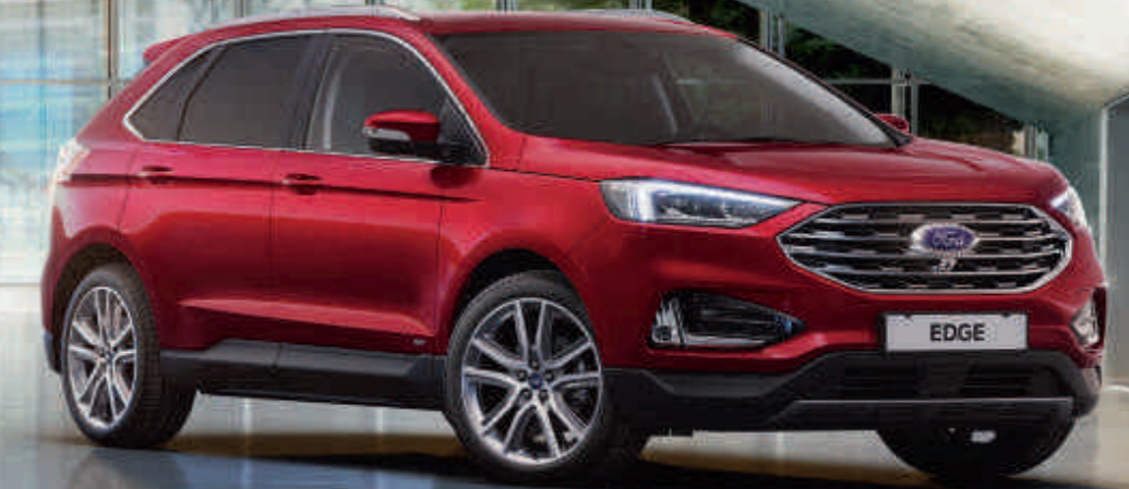
Edge Titanium in Ruby-Rot Metallic mit 20"-Leichtmetallrädern im 5x2-Speichen-Design (Wunschausstattung).

Kraftstoffverbrauch und CO 2 -Emissionen für alle in der Broschüre aufgeführten Modelle nach § 2 Nrn. 5, 6, 6a Pkw-EnVKV in der jeweils geltenden Fassung: 6,7-5,7 l/100km (kombiniert); 174-148 g/km (kombiniert).