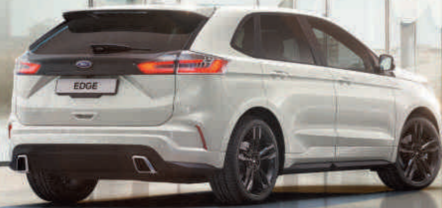
Edge ST-Line in Arktis-Weiß Metallic mit 21"-Leichtmetallrädern im 5x2-Speichen- Design (Wunschausstattung).