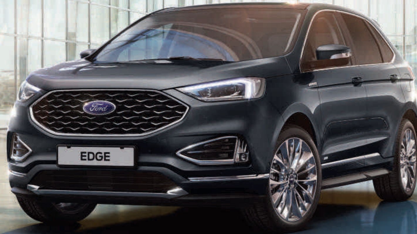
Edge Vignale in Magnetic-Grau Metallic mit 20"-Leichtmetallrädern im 10-Speichen- Design (Wunschausstattung).