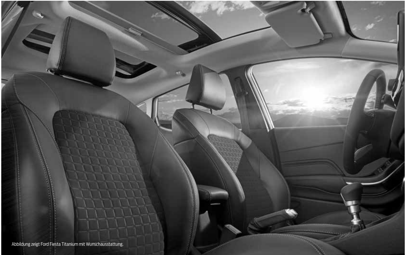
Abbildung zeigt Ford Fiesta Titanium mit Wunschausstattung.