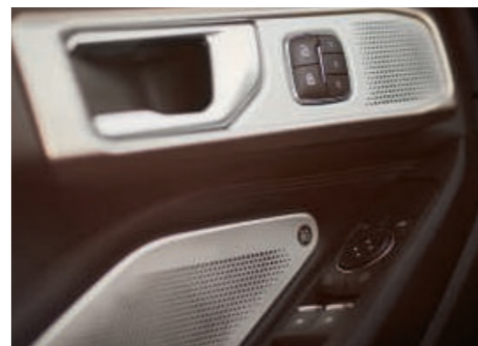
B&O Sound System mit 980 Watt und 14 Lautsprechern