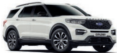
Liquid-Weiß 1) Normalfarbe