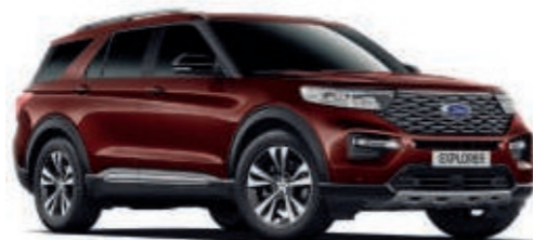
Amaranth-Braun 2) Spezielle-Metallic-Lackierung*