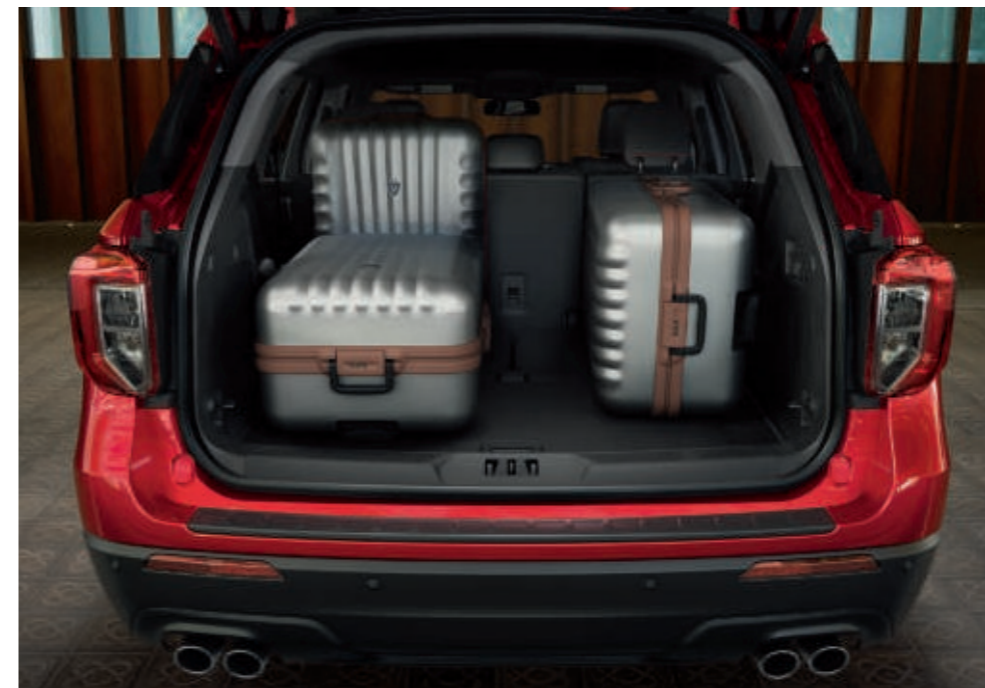
Abbildung zeigt neuen Ford Explorer ST-Line in Lucid-Rot Metallic mit 20"-Leichtmetallrädern im 5x2-Speichen-Design, in Schwarz glanzgedreht (Wunschausstattung).

*Im 2-Sitzer-Modus einschließlich 51 Litern unter der Ladefläche und 4 Litern im Ablagefach.