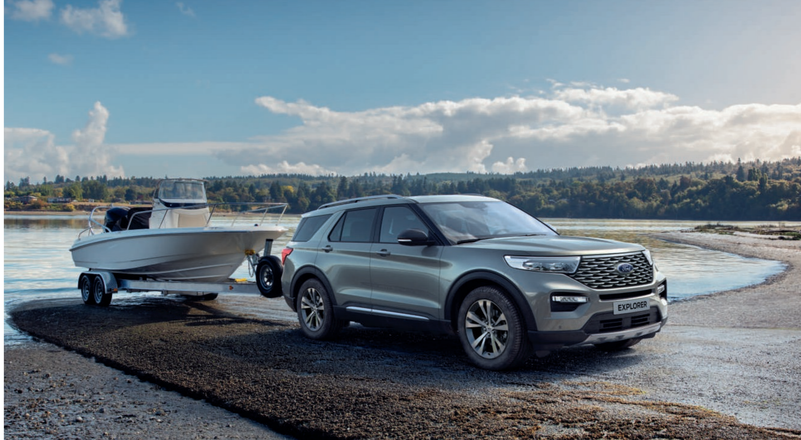
Abbildung zeigt neuen Ford Explorer Platinum in Iconic-Silber Metallic mit 20"-Leichtmetallrädern im 5x2-Speichen-Design, in Dark Tarnished glanzgedreht (Wunschausstattung).

Egal ob Hobby oder Beruf, mit dem neuen Ford Explorer lässt sich jede Situation stilvoll meistern.