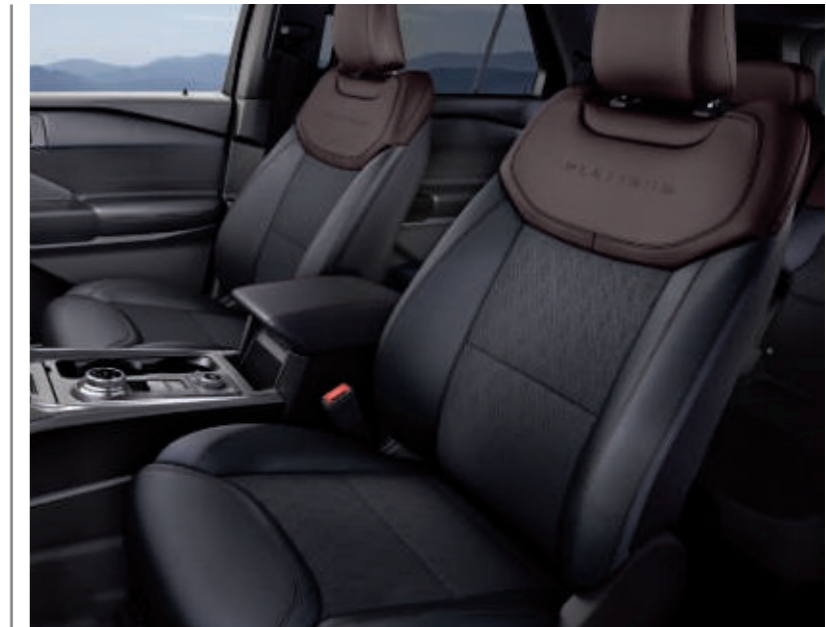
Premium-Lederpolsterung* in Schwarz mit perforierter Sitzmittelbahn und abgesetztem Kopfteil in Braun