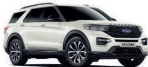
Star-Weiß Spezielle Metallic-Lackierung*