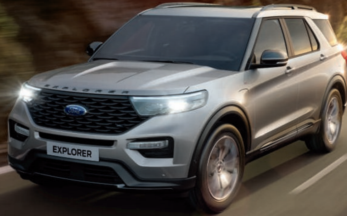
Abbildung zeigt neuen Ford Explorer ST-Line in Iconic-Silber Metallic mit 20"-Leichtmetallrädern im 5x2-Speichen-Design, in Schwarz glanzgedreht (Wunschausstattung).

Begrüßen Sie den sensationellen neuen Ford Explorer, ein SUV mit Plug-in-Hybrid-System. Die Kombination aus elektrifizierter Hybridtechnologie und großzügiger, luxuriöser Innenausstattung setzt in Bezug auf stilvolles Design und mühelose Leistung völlig neue Maßstäbe. Der neue Ford Explorer Plug-in-Hybrid vereint Eleganz und Substanz auf einzigartige Weise zu einer verführerischen Mischung aus kühnem und solidem Design, Dynamik und Raffinesse. All dies wird durch modernste Technologien abgerundet, die für Sicherheit, Konnektivität und Unterhaltung sorgen.