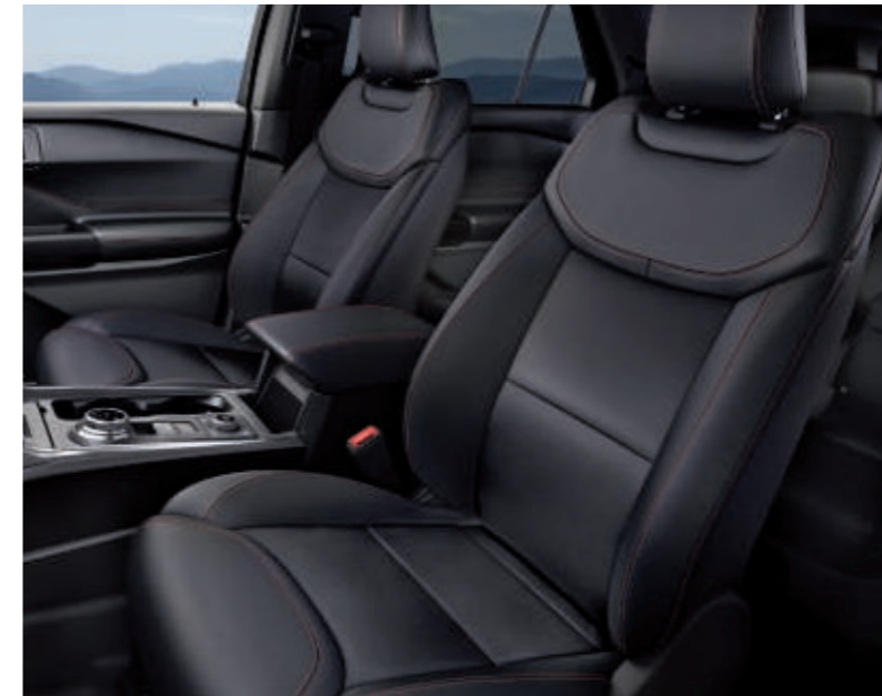
Premium-Lederpolsterung* in Schwarz mit perforierter Sitzmittelbahn und roten Ziernähten

Im neuen Ford Explorer sind Eleganz und Handwerkskunst auf wunderbare Weise vereint. Egal, ob Sie auf dem Fahrersitz Platz nehmen oder als Fahrgast die Reise genießen: Aussehen und Haptik der Premium-Materialien setzen den großzügig dimensionierten Innenraum perfekt in Szene und spiegeln eine Wertigkeit wider, die ihresgleichen sucht.