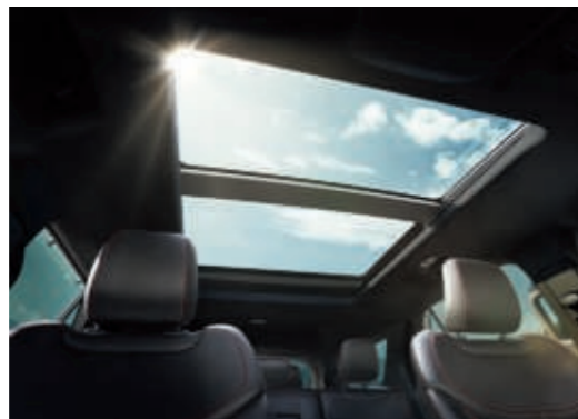
Zweiteiliges Panorama-Schiebedach, elektrisch, mit "Solar Reflect"-Wärmeschutz und elektrischer Sonnenblende