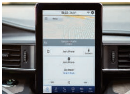
10,1-Zoll-Touchscreen, Hochformat (25,7 cm Bildschirmdiagonale)