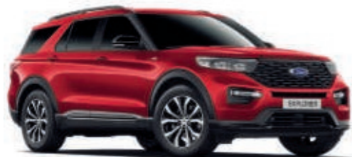
Lucid-Rot Spezielle Metallic-Lackierung*