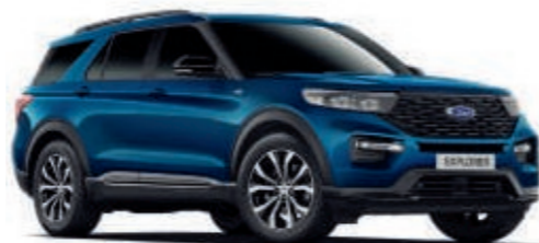
Atlas-Blau 1) Metallic-Lackierung*