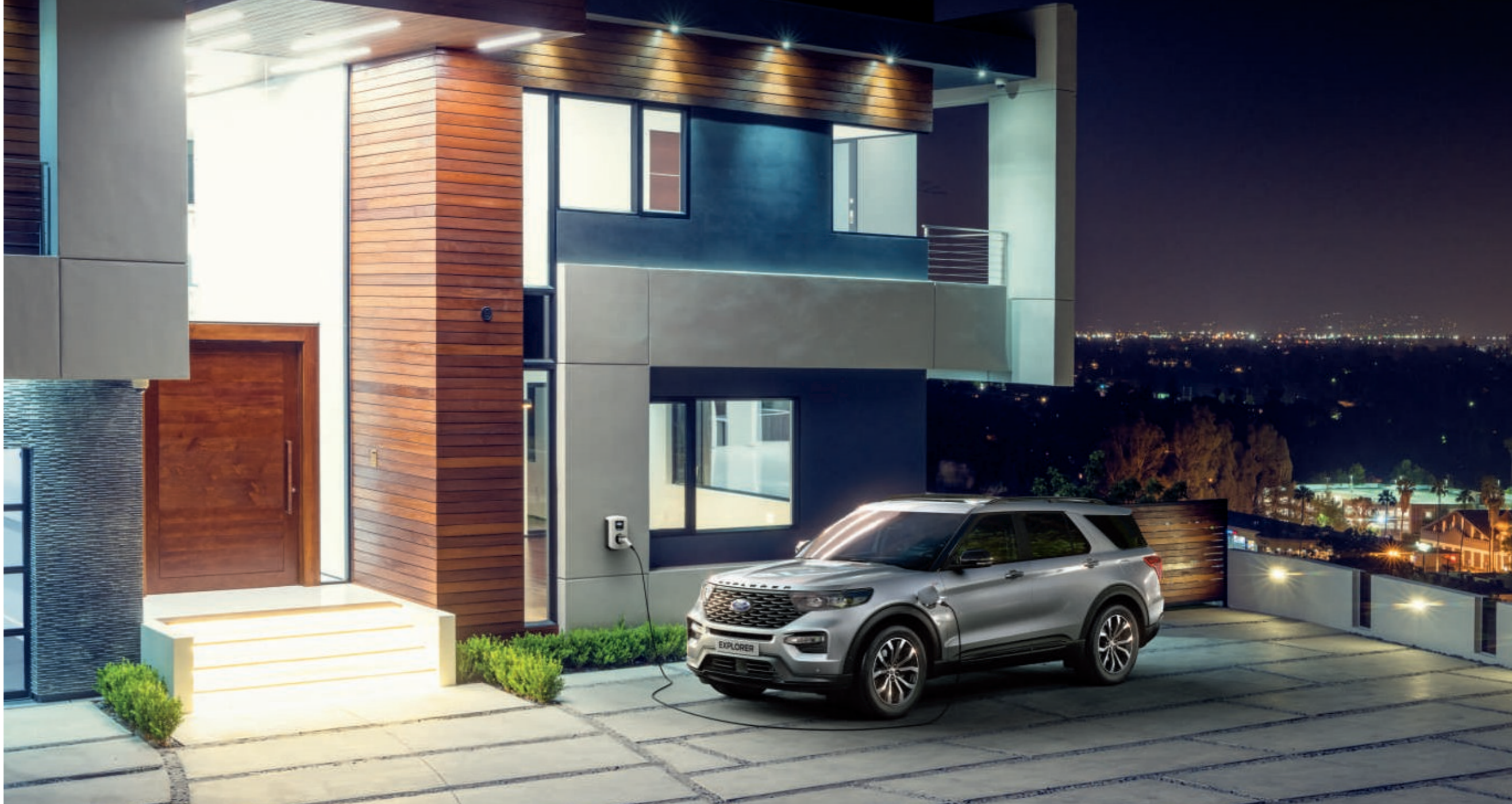
Abbildung zeigt neuen Ford Explorer ST-Line in Iconic-Silber Metallic mit 20"-Leichtmetallrädern im 5x2-Speichen-Design, in Schwarz glanzgedreht (Wunschausstattung).

Hinweis: Die jeweiligen Verbrauchs- und Emissionswerte finden Sie ab Seite 42 dieser Broschüre.