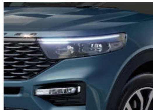
LED-Scheinwerfer, dunkel abgesetzt